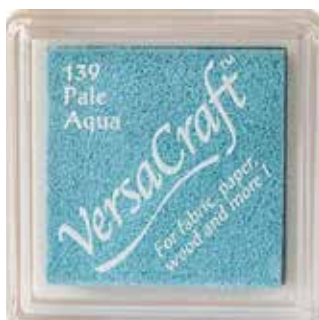
CRAFT07 - Pale aqua