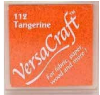
CRAFT15 - Tangerine