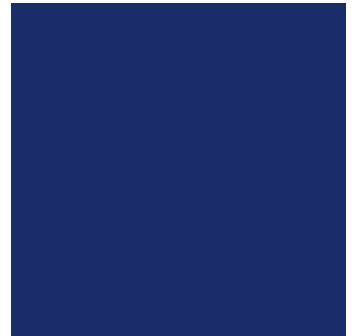
FINE04 - Majestic blue