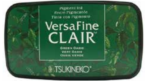
CLAIR21 - Vert oasis