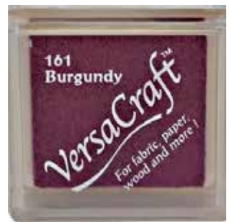
CRAFT12 - Burgundy