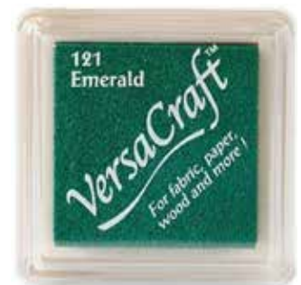
CRAFT18 - Emerald