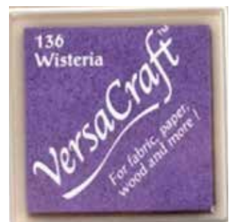
CRAFT09 - Wisteria