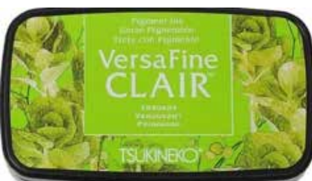
CLAIR22 - Verdoyant