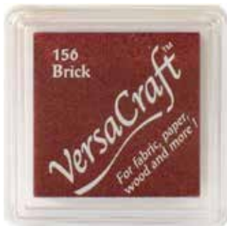
CRAFT13 - Brick