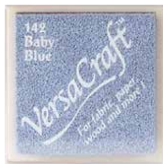
CRAFT08 - Baby blue