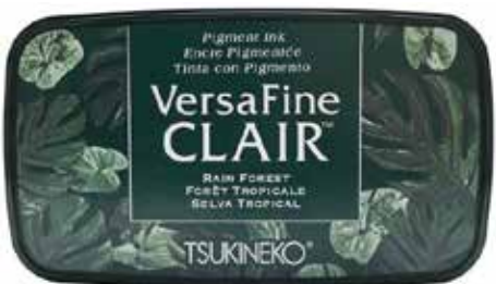
CLAIR19 - Forêt tropicale