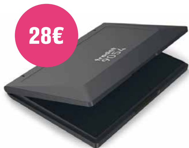
TRODAT04 - 148 x 210 mm (A5)