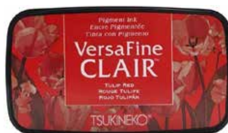
CLAIR08 - Rouge tulipe