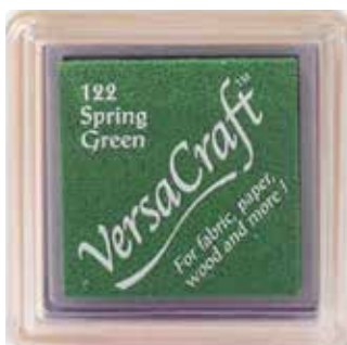
CRAFT19 - Spring green