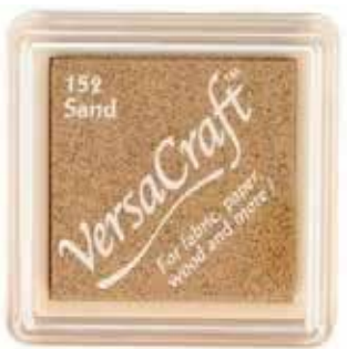
CRAFT16 - Sand