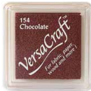
CRAFT14 - Chocolate