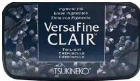
CLAIR02 - Crépuscule