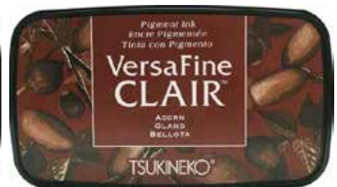
CLAIR06 - Gland