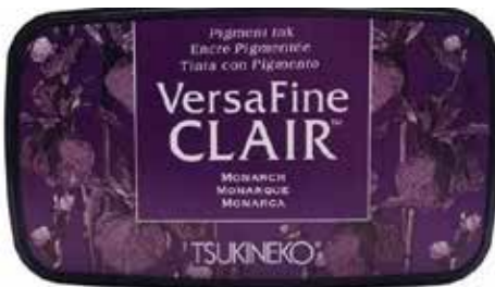
CLAIR13 - Monarque