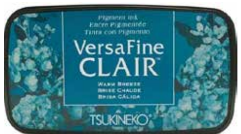
CLAIR18 - Brise chaude