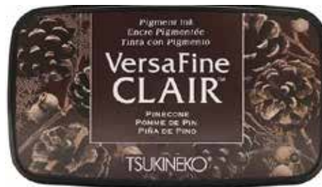
CLAIR05 - Pomme de pin