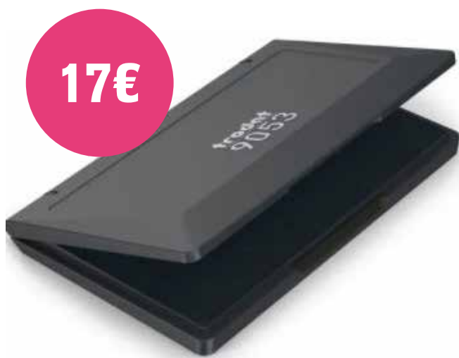
TRODAT03 - 160 x 90 mm