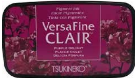
CLAIR11 - Plaisir violet