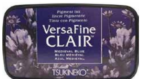
CLAIR15 - Bleu médiéval