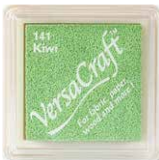
CRAFT20 - Kiwi