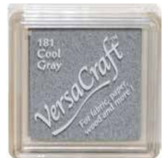
CRAFT03 - Cool Gray