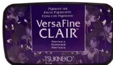
CLAIR14 - Fantaisie