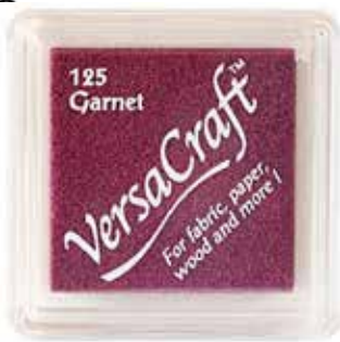
CRAFT10 - Garnet