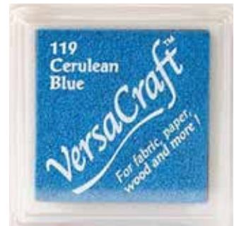
CRAFT06 - Cerulean blue