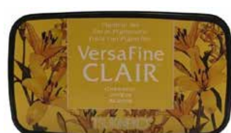
CLAIR23 - Joyeux