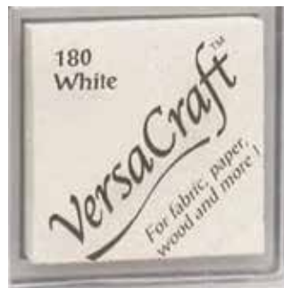
CRAFT02 - White