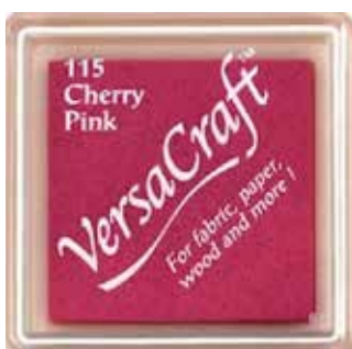
CRAFT22 - Cherry pink