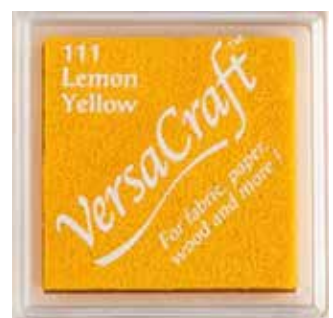
CRAFT24 - Lemon yellow