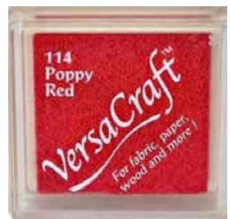
CRAFT21 - Poppy red