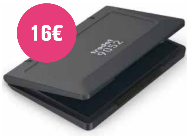
TRODAT02 - 110 x 70 mm