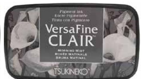
CLAIR03 - Rosée matinale