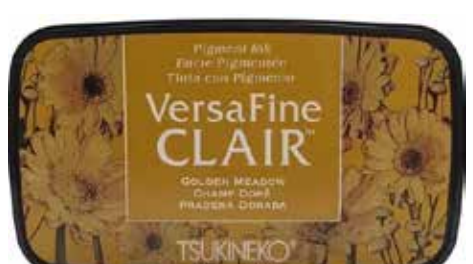
CLAIR24 - Champ doré