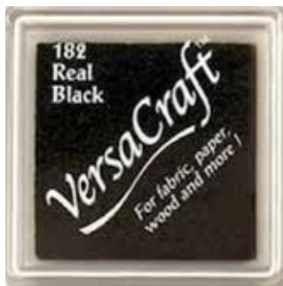
CRAFT01 - Real Black

Si votre tampon est un peu plus grand que l'encreur, ce n'est pas un soucis ! Il suffit de tapoter l'encreur sur le tampon posé sur la table pour que ce soit plus pratique.