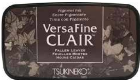
CLAIR04 - Feuilles mortes