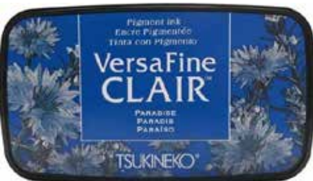
CLAIR16 - Paradis