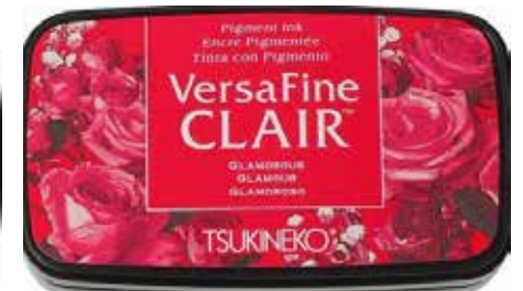
CLAIR09 - Glamour