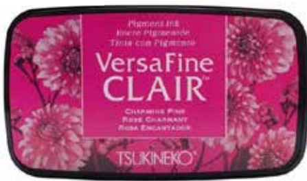
CLAIR10 - Rose charmant