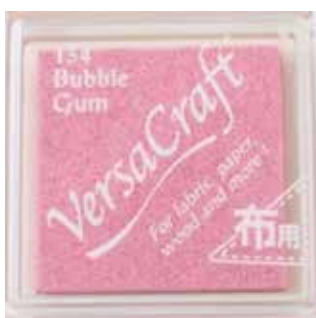
CRAFT23 - Bubble gum