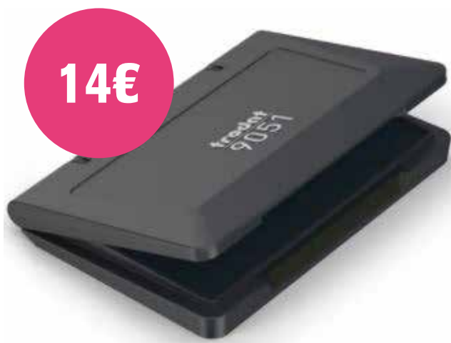
TRODAT01 - 90 x 50 mm