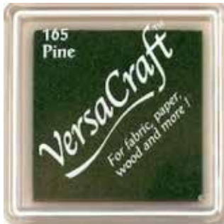
CRAFT17 - Pine