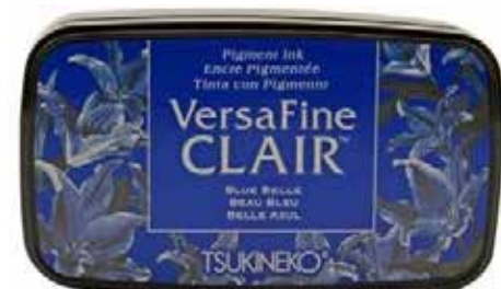
CLAIR17 - Beau bleu