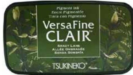
CLAIR20 - Allée ombragée