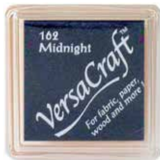
CRAFT04 - Midnight