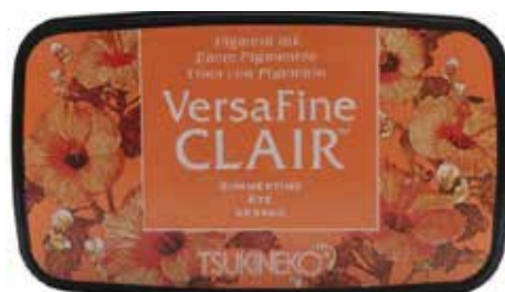
CLAIR07 - Été