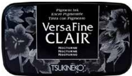
CLAIR01 - Nocturne

Si votre tampon est un peu plus grand que l'encreur, ce n'est pas un soucis ! Il suffit de tapoter l'encreur sur le tampon posé sur la table pour que ce soit plus pratique.