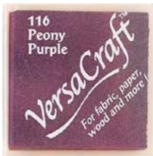
CRAFT11 - Peony purple