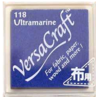
CRAFT05 - Ultramarine