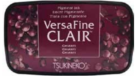
CLAIR12 - Chianti